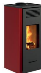
rosso cod. 70410509051