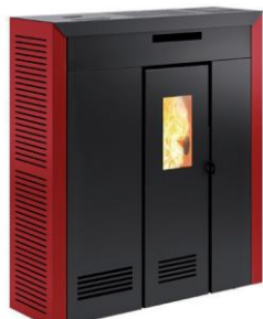
rosso cod. 7241041805I