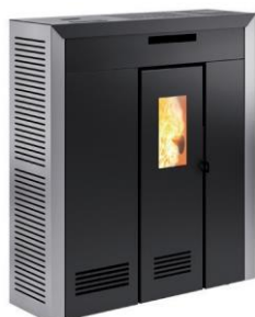
grigio cod. 7241041802I